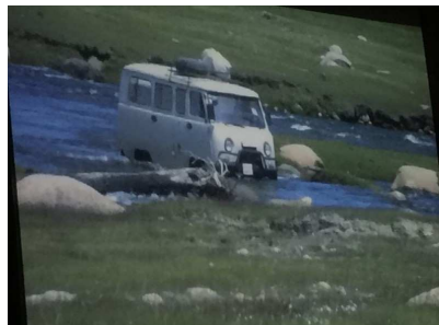
車の渡渉シーン(動画より)