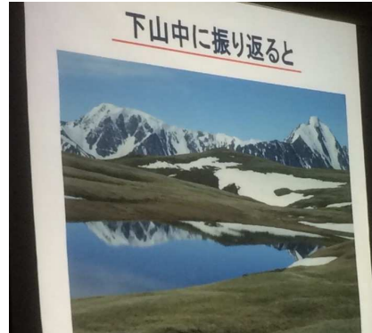
モンゴルには起伏あり