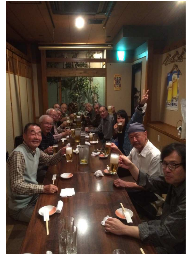
こじんまり二次会