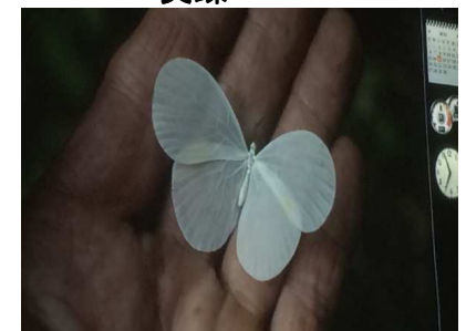
マルバネシロチョウ