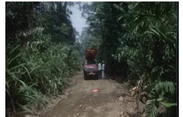
カメルーン採集地の一つ