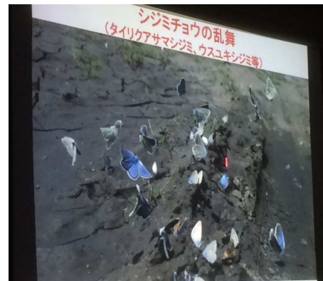
最近では大量吸水も規模減のよう