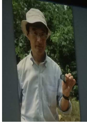
ザルモクシスを得た前川氏