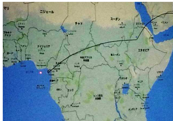
カメルーン的位置