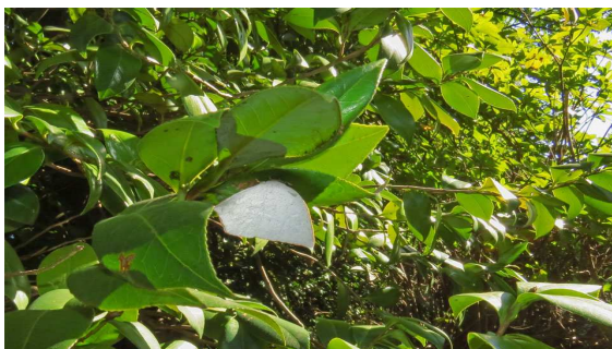
ウラギンシジミ♀ (品川区)