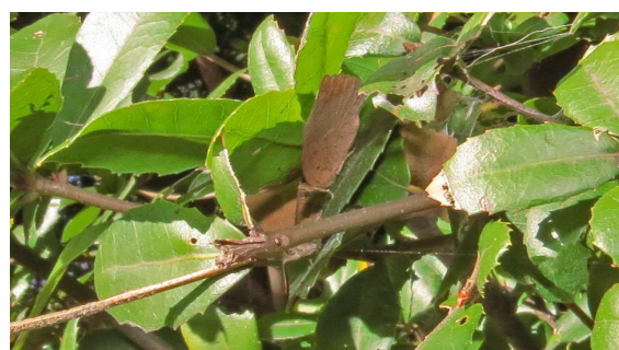
ムラサキシジミ2匹 (品川区)